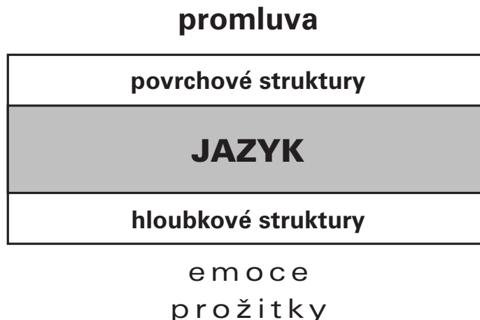
obrázek 1: Geneze promluvy

Hodnocení a jazyk, kterým se hodnocení kodifikuje a komunikuje, při detailnějším nepředpojatém pohledu (z hlediska: i nenormální jevy jsou vždy a bezesporu v jistém smyslu normální ) dodnes vytvářejí specificky vondráčkovský – a tak trochu zapomenutý či zapomínaný – kontext: Nejenom prostory reálné kodifikace/komunikace a její generující mentální prostory (tj. dynamická pole účinku), ale i nástroje komunikace, jazyk se svými verbálními i neverbálními, sémantickými i manipulospatiálními strukturami, mají složitou mnohaúrovňovou výstavbu. Každé aktualizované slovo představuje mnohonásobné transfery, každé slovo , vnitřně prožívané i veřejné (tj. vnitřně různorodě prožívané mnohými subjekty), je překladem ( přetlumočením ) jazyka prožitku do jazyka konfrontace prožitku s prostředím událostí, do jazyka kontinuí prožívaných situací, do jazyka subjektivní kultivace konsenzu či diskonsenzu ve vztahu k prožitkům jiných subjektů. Každé komunikací aktualizované slovo je tudíž psychologicky spojeno s elementární depersonalizací , s parciálním odosobněním , jak je zřejmé i z připojeného jednoduchého obrázku, který zároveň, ve vztahu k médiím, chápu především jako detailněji segmentovanou kodifikační fázi Osgood – Schrammova spirálového modelu cirkulující in -formace faktu.